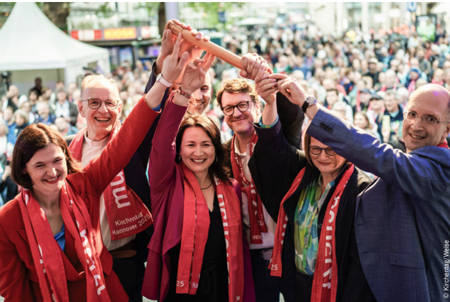
Von Hannover nach Düsseldorf: Staffellübergabe auf dem Kirchentag 2025.

sich streiten können – respektvoll. Kirche und Kirchentag sind solche Orte. Sie sind nicht politisch um des Politischen willen, sondern weil sie Werte verteidigen: Menschenwürde, Freiheit, Verantwortung. Das Evangelium ist zutiefst politisch, weil es Haltung verlangt. Aber ohne Absolutheitsanspruch. Ins Gespräch kommen bedeutet auch, dass der andere recht haben kann. Diese Haltung wünsche ich mir für unser Land.