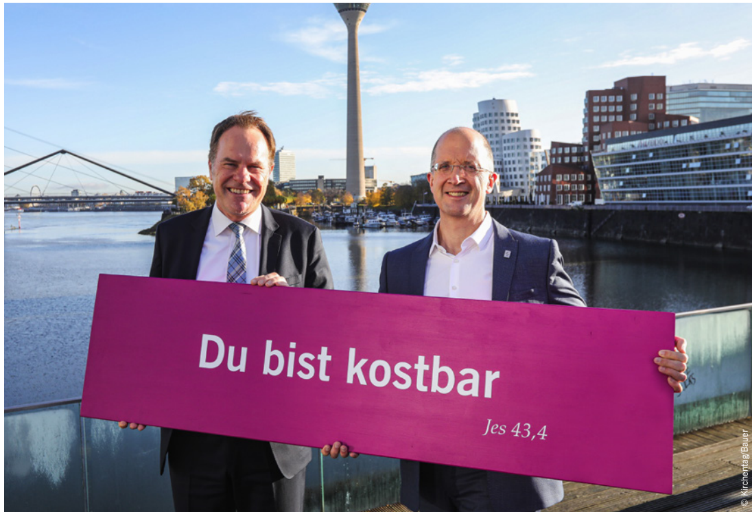
Oberbürgermeister Stephan Keller (l.) und der Präsides der Evangelischen Kirche im Rheinland, Thorsten Latzel, präsentieren die Losung am Düsseldorfer Hafen.