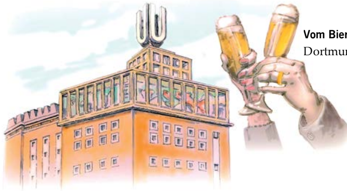
Vom Bier zum Kulturzentrum – Dortmunder U